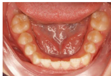
Dolní zubní oblouk (počáteční)