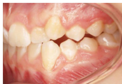
Skus vlevo (počáteční)