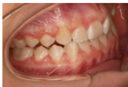
Skus vpravo (počáteční)