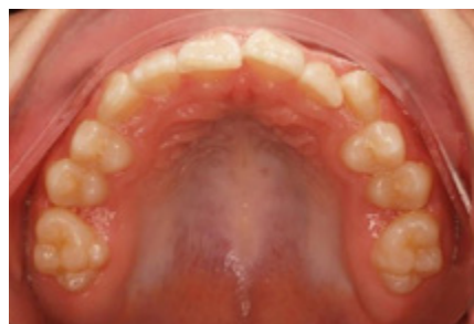
Horní zubní oblouk (počáteční)