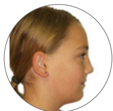
Profil v klidu (počáteční)