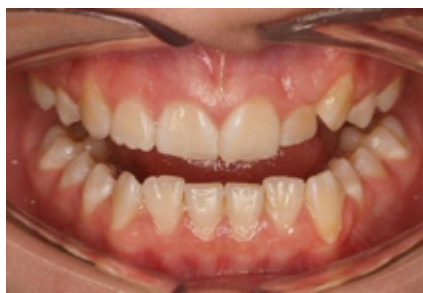
Frontální pohled pootevřený (počáteční)