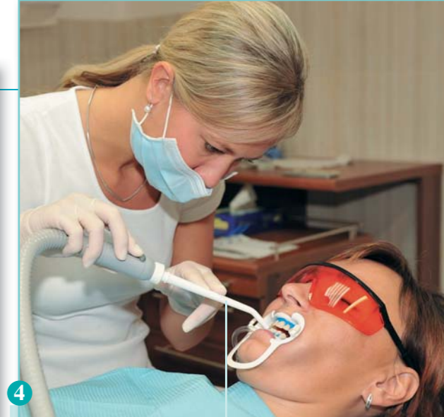
4 Gel se nechá působit 10 minut, poté se krouživými pohyby znovu aktivuje a nechá působit další desetiminutovku. Po celou dobu procedury musí být ústa úplně suchá, takže mi v nich občas zařazuje malý vysavač