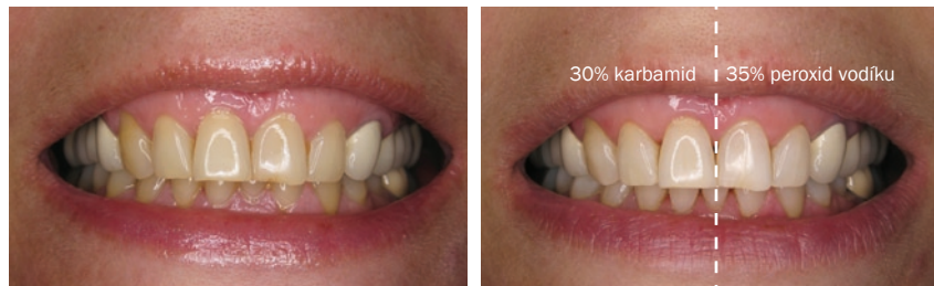
Obr. 6 Stav před bělením (vlevo) a stav po bělení (vpravo)

Efekt provedeného ordinačního bělení byl vyhovující. Barevná diskrepance mezi vlastními zuby a protetickými konstrukcemi byla zkorigována (Obr. 6, 7). Mezi pravou a levou polovinou čelistí jsme klinicky nenalezli barevný rozdíl.