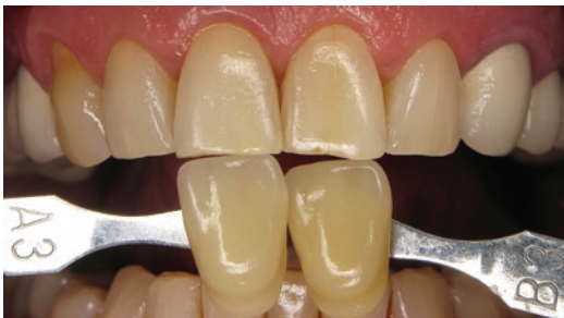
Obr. 2 Stanovení barevného odstínu zubů před bělením

Výchozí odstín zubů byl určen pomocí originálního vzorníku Vita® jako A3 (Obr. 2).