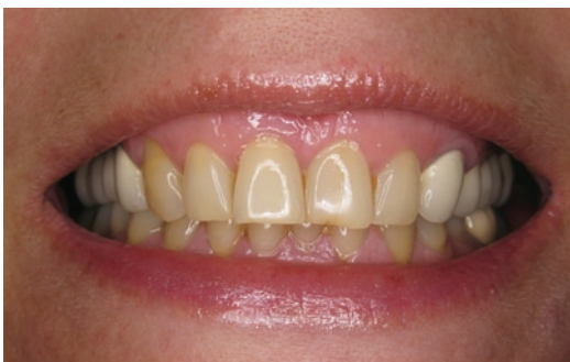
Obr. 1 Stav před bělením

45letá celkově zdravá žena neužívající žádné léky požadovala zesvětlení frontálních zubů horní i dolní čelisti. Pacientka je nekuřačka, denně pije cca 3 šálky černé kávy, zvýšenou citlivost zubů neudává. Postranní úseky chrupu ve všech kvadrantech byly přibližně před 15 lety rekonstruovány fixními metalokeramickými můstky. Podle sdělení pacientky zhotovené protetické práce původně barevně odpovídaly frontálním zubům. Po 15 letech je stav protetických prací stále funkčně i esteticky vyhovující. Barevně jsou však již zřetelné diskrepance mezi vlastními zuby a můstkovými konstrukcemi, které se oproti frontálním úsekům jeví světlejší (Obr. 1).