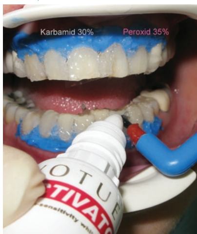
Obr. 4 Aplikace aktivátoru