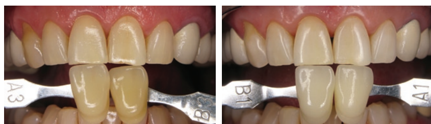
Obr. 7 Stanovení barevného odstínu před bělením (vlevo) a po bělení (vpravo)

Porovnáním s originálním vzorníkem Vita® (Obr. 8) seřazeného dle světlosti bylo zjištěno, že během ordinační fáze bělení byl dosažen odstín A1 (Obr. 7), což znamená, že došlo k zesvětlení zubů o 7 odstínů.