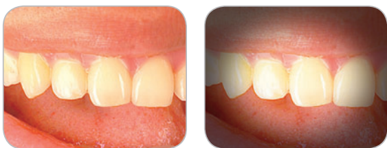
rovnoměrné osvětlení Digora® Vidi